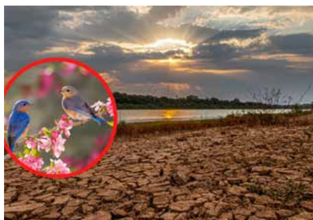
El cuerpo de agua ha sufrido una desecación, producto de la arborización invasora en la zona y la mala intención y uso de los terratenientes

Inicialmente, el proyecto buscó tomar la Laguna de Palacio, la más pequeña y afectada del complejo, para