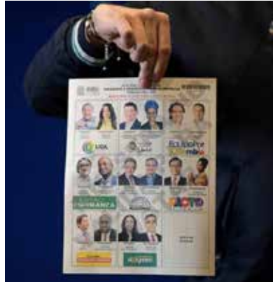
Tarjetón de las elecciones presidenciales 2022

Por otra parte, está Rodrigo Lara Sánchez de frente con Federico Gutiérrez. Un hombre de 51 años neivano hijo del asesinado exministro Ro-