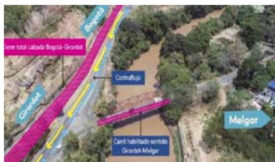
Melgar Tolimaida nuevo puente.

Las actividades preliminares se cumplirán entre "febrero y marzo" y consiste en labores preliminares necesarias en la construcción del nuevo puente en Melgar.